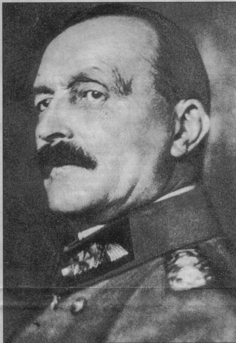
Generalleutnant Dr. Hermann von Stein, von 1916 bis 1918 Kriegsminister, erfüllte damals die Forderung Hindenburgs nach einer Steigerung der Munitionsherstellung.

Ernst Konrad von Wrisberg (1863 bis 1927), Generalmajor, war zu dieser Zeit Direktor des Allgemeinen Kriegsdepartements, das zuständig war für die Versorgung des Heeres mit Waffen, Munition und Geräten aller Art. Wrisberg un-