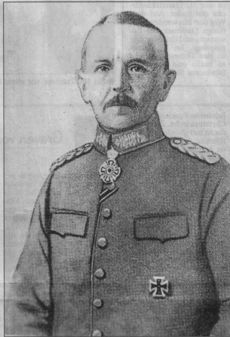
Ernst Konrad von Wrisberg ordnete 1916 als Direktor des allgemeinen Kriegsdepartements die Errichtung des Munitionsdepots in Reckenfeld an.