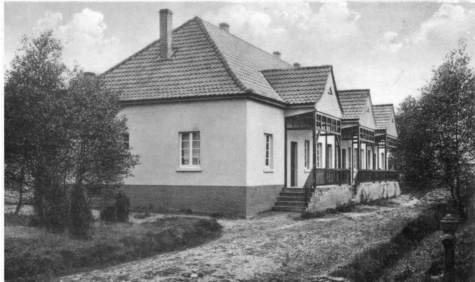
Um die drohende Zerstörung des Depots abzuwenden, baute die Eisenhandelsgesellschaft Ost 20 Musterhäuser. Diese drei Häuser im Block D gibt es heute immer noch. Sie stehen am Drosselweg, Ecke Elsterweg.