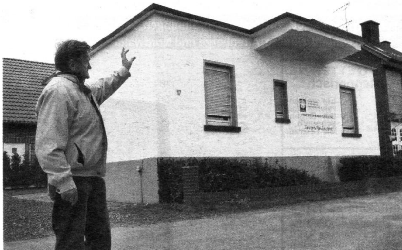
Viele der ehemaligen Munitionslager sind noch erhalten, so wie dieser im Block C. Direkt davor stoppten die Güterwaggons.

Verschiedene Theorien über „Geburtsjahr“