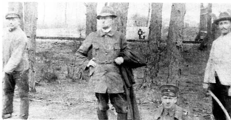
Militär-Ingenieure und Arbeiter im Jahr 1918.