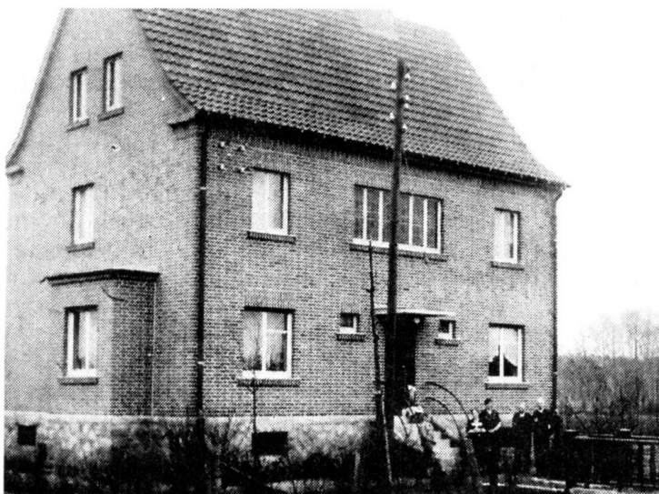
Das Haus der Fam. Dr. Isfort an der Bahnhofstraße.