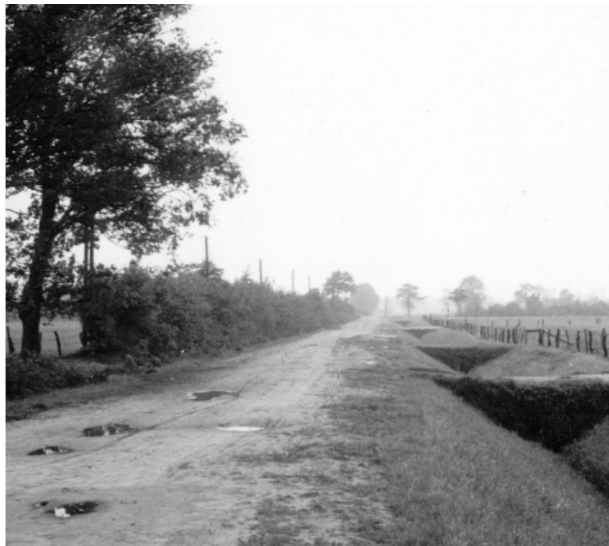
So sah sie aus, die alte Kanalstraße.