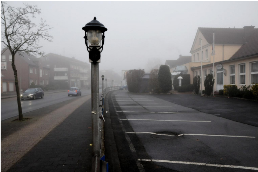
Auch das hier ist noch Ortsmitte: Die Grevener Landstraße am »Deutschen Haus« soll attraktiver werden.