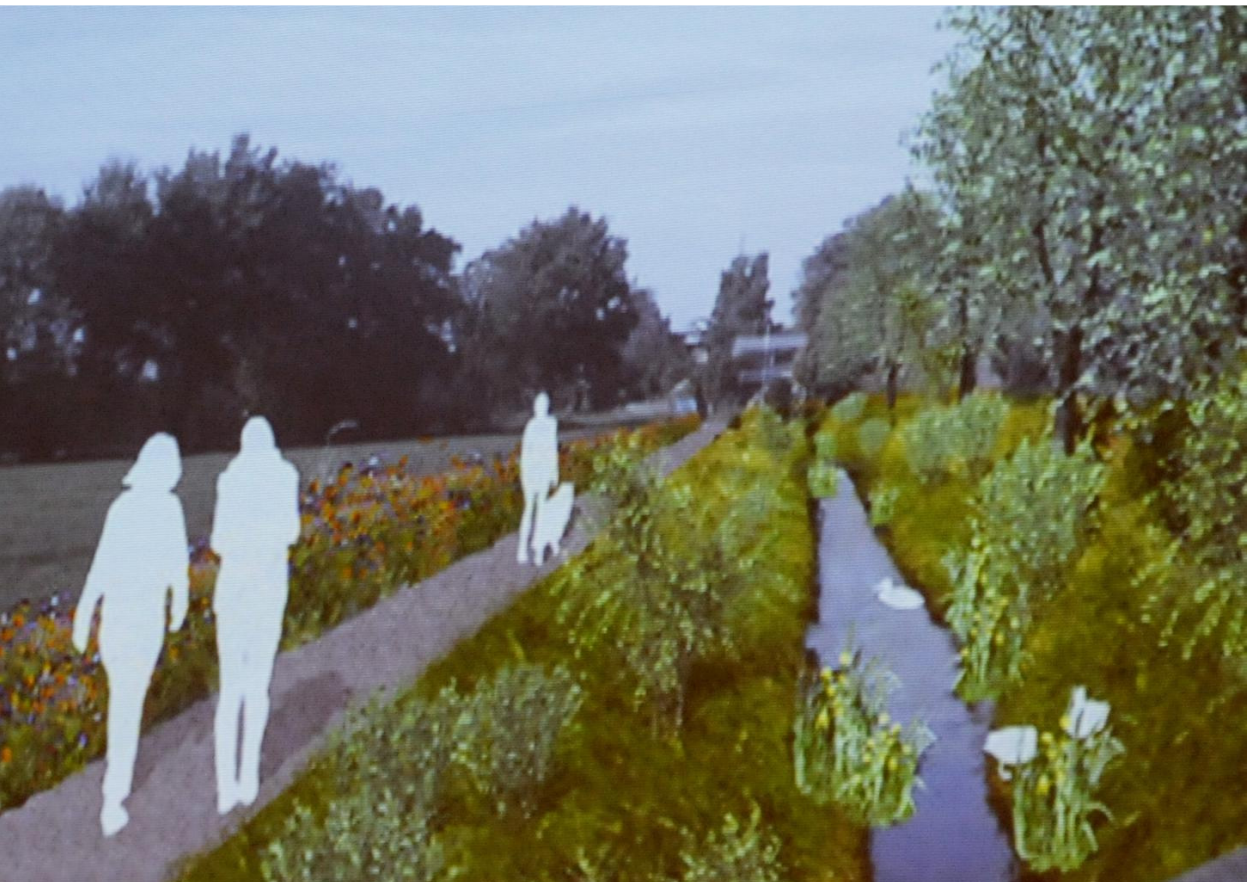
So könnte der Walgenbach einmal aussehen.