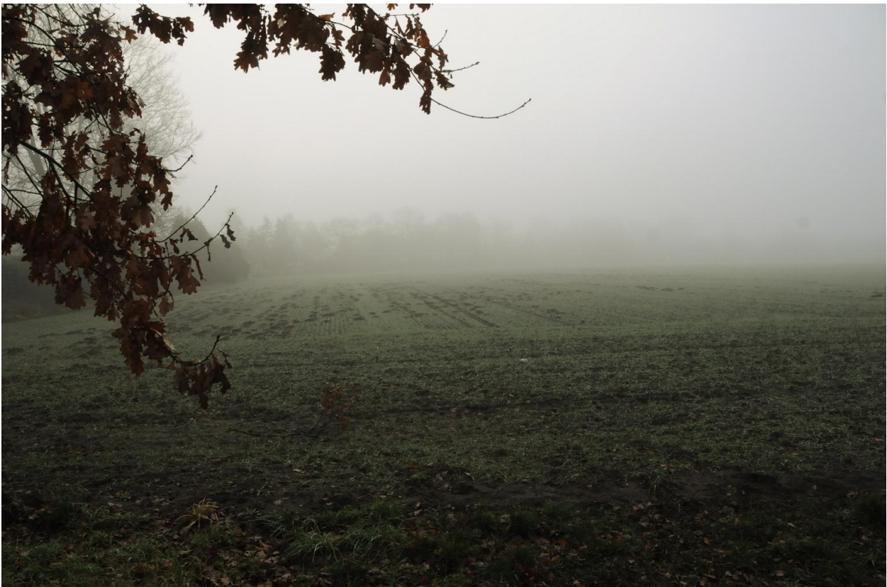
Auf diesem Feld könnte die »Reckenfelder Wiese« entstehen.