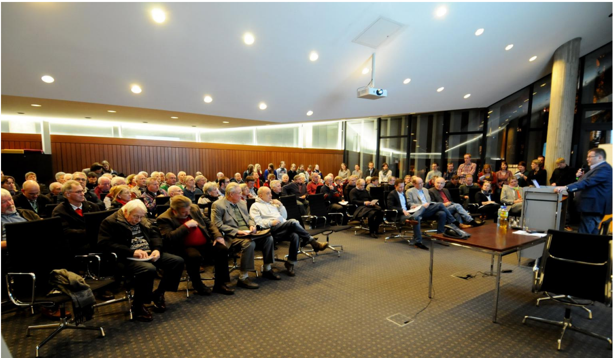
Über 100 Reckenfelder waren am Mittwochabend in den großen Ratssaal gekommen, um zu hören, wie ihr Heimatort lebenswerter werden kann.