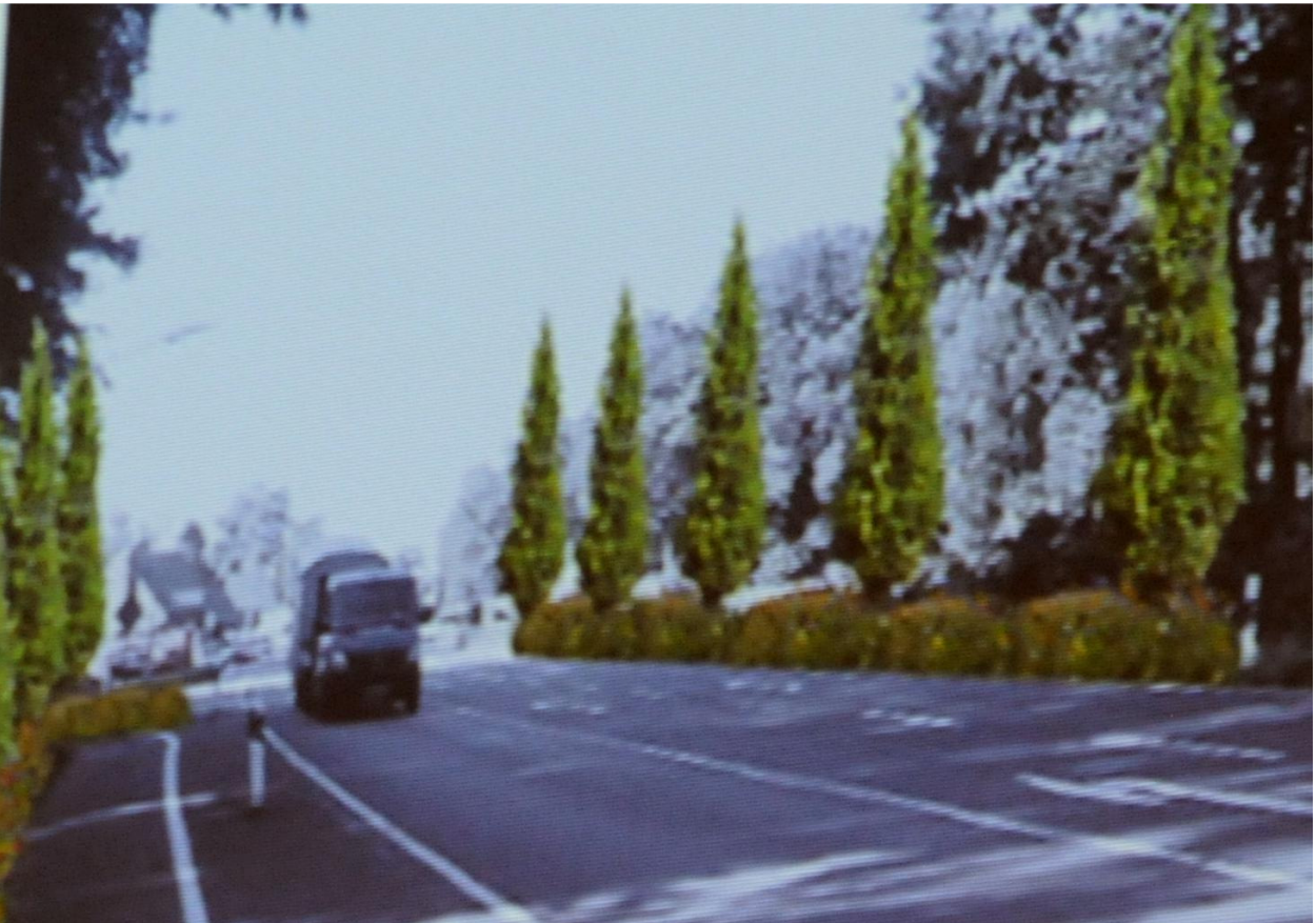
Die Ortseinfahrten könnten mit Baumreihen betont werden.