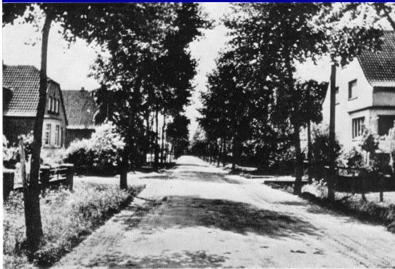
Bahnhofstraße, rechts Dilla