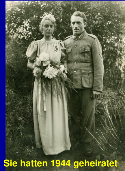
Sie hatten 1944 geheiratet

Unsere Schafe mußten nachts draußen bleiben, weil wir keinen Stall hatten. Das große Schaf war schon krank und wir mußten es ab und zu aus dem Unwetter heraus in die warme Küche bringen, damit es sich wieder erholte. Unsere Hühner lagen draußen im Sack bis wir einen behelfsmäßigen Stall fertig hatten. Nun sitzen wir noch im größten Rummel und wissen nicht wo hin mit unseren Sachen.