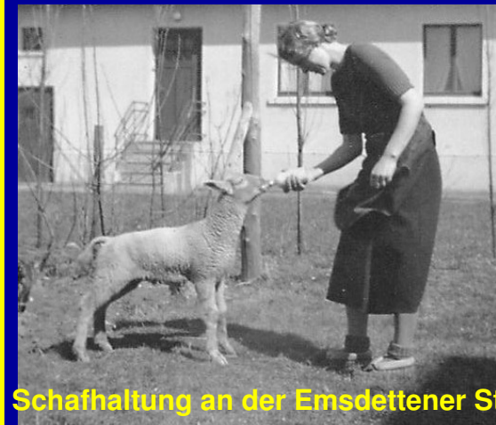
Schafhaltung an der Emsdettener Str.